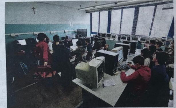
La scuola media Aldo Moro sarà sede di certificazione Ket

Selezionato per la certificazione Ket di lingua inglese L'ex Secondo circolo diventa sede di esame per Cambridge